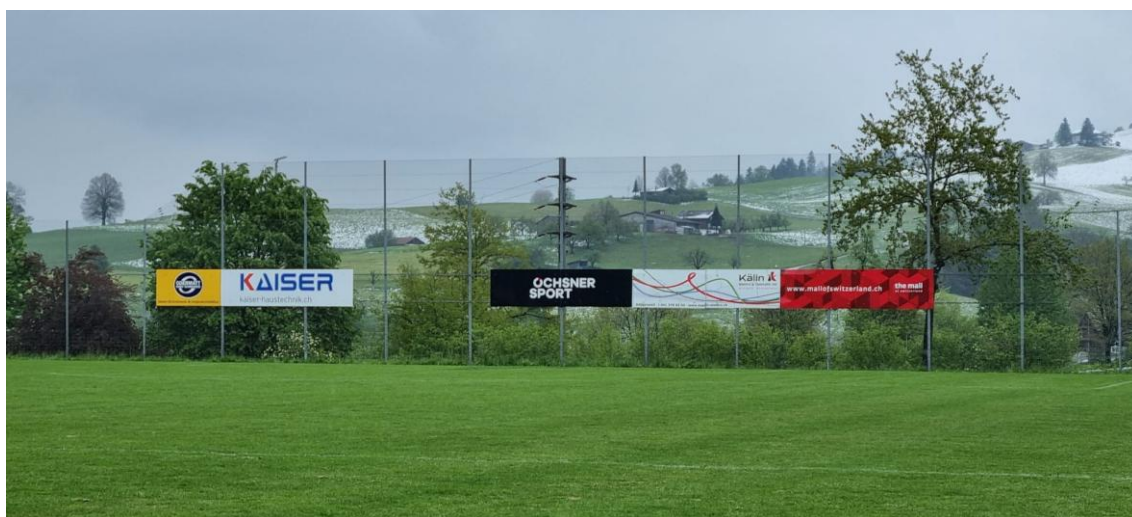
Bande am Hauptfeld; Einzelbande (z.B. Odermatt) und Doppelbande (z.B. Ochsner)

Alle Beträge in Schweizer Franken und inklusive Mehrwertsteuer